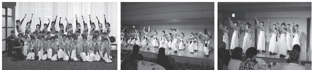
懇親会アトラクション(山村国際高校 よさこい部)