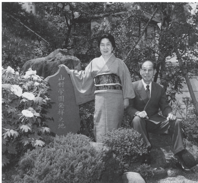
昭和57年6月6日「山村学園発祥の地」記念碑除幕式の日

を買い取り内部を改装して援助をした。ぬみよは両親に感謝をして「裁縫手芸伝習所山村塾」の看板を掲げたのは大正11年(1922年)9月1日20歳の誕生日であり、現在の山村学園が第一歩を踏み出した日であった。(5月記す)