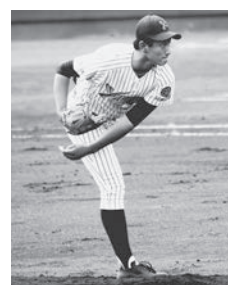
習志野高校(対 習志野高校) 和投投手 望の施設が整備され、より、ようやく待たれます。

これまで、風雨や落雷から身を守る施設がありませんでした。が、地権者のご協力と川越市をはじめ多くの関係者の