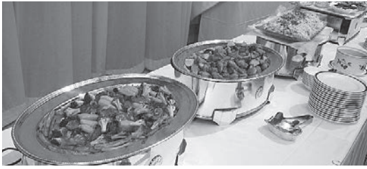
懇親会でのお料理