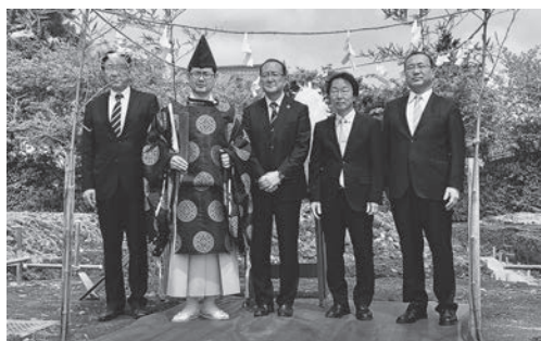
野田グラウンド 防災施設地鎮祭

また、野田グラウンドでは4月末に地鎮祭を執り行い、避難所兼雨天練習場の建設がはじまりました。