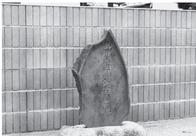
山村学園発祥の地の碑

むらさき会から昭和57年(1982年)創立60周年記念として贈られた山村学園発祥の地の碑は、山村学園が喜多院から参道より新たに土地を借りて移設いたしました。