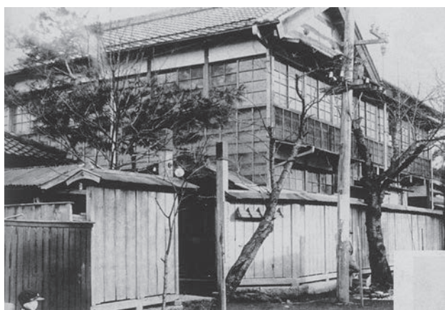
山村高等裁縫女学校校舎(昭和10年)

貧しい農民の生活をしてきた両親は、故郷を離れて現在の川越市にあった石川組製糸工場に住み込みで働いた。