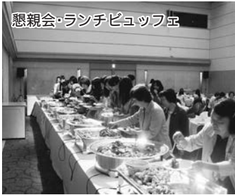
懇親会・ランチピュッフ