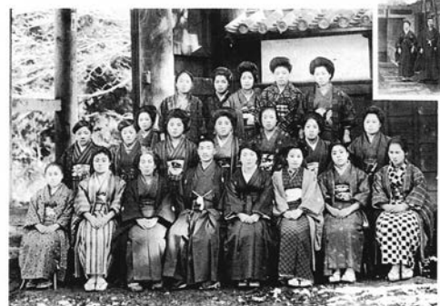
山村塾新設記念 (大正12年2月1日)