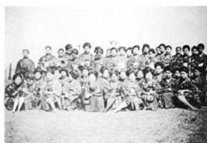
塾生遠足・東村山貯水池にて (大正14年4月15日)