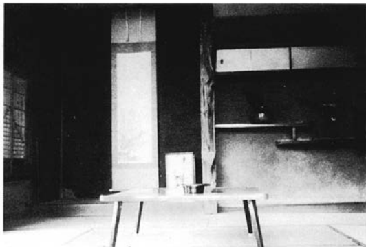
開塾当初の塾生を教えた部屋