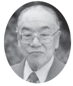
むらさき会 相談役