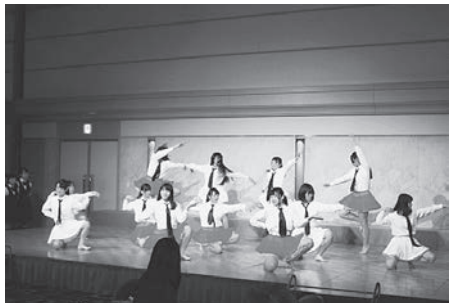
懇親会アトラクション(山村国際高校ダンス部)

に自分自身の中にあつた氷が溶け、今では毎日大学に行きたいほど楽しくて仕方がありません。人には必ずきっかけがあり、それが夢にもなります。これからも、夢を追いつけてください。